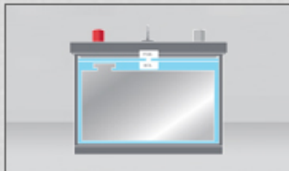
batería convencional con diseño tradicional